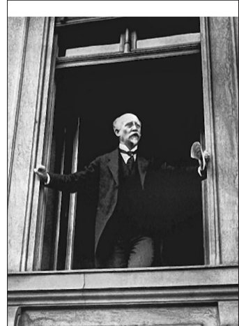
Philipp Scheidemann ruft die Republik aus.